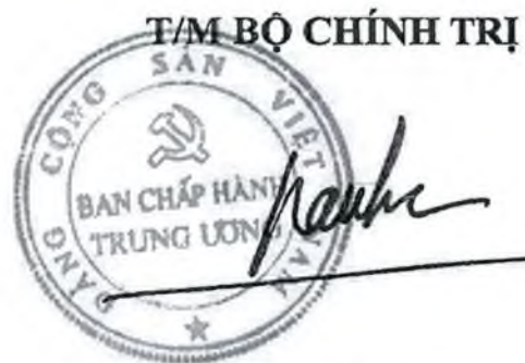
Trần Cẩm Tú