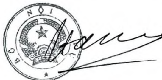
Phạm Thị Thanh Trà BỘ TRƯỞNG BỘ NỘI VỤ

KT. TRƯỞNG BAN PHÓ TRƯỞNG BAN THƯỜNG TRỰC