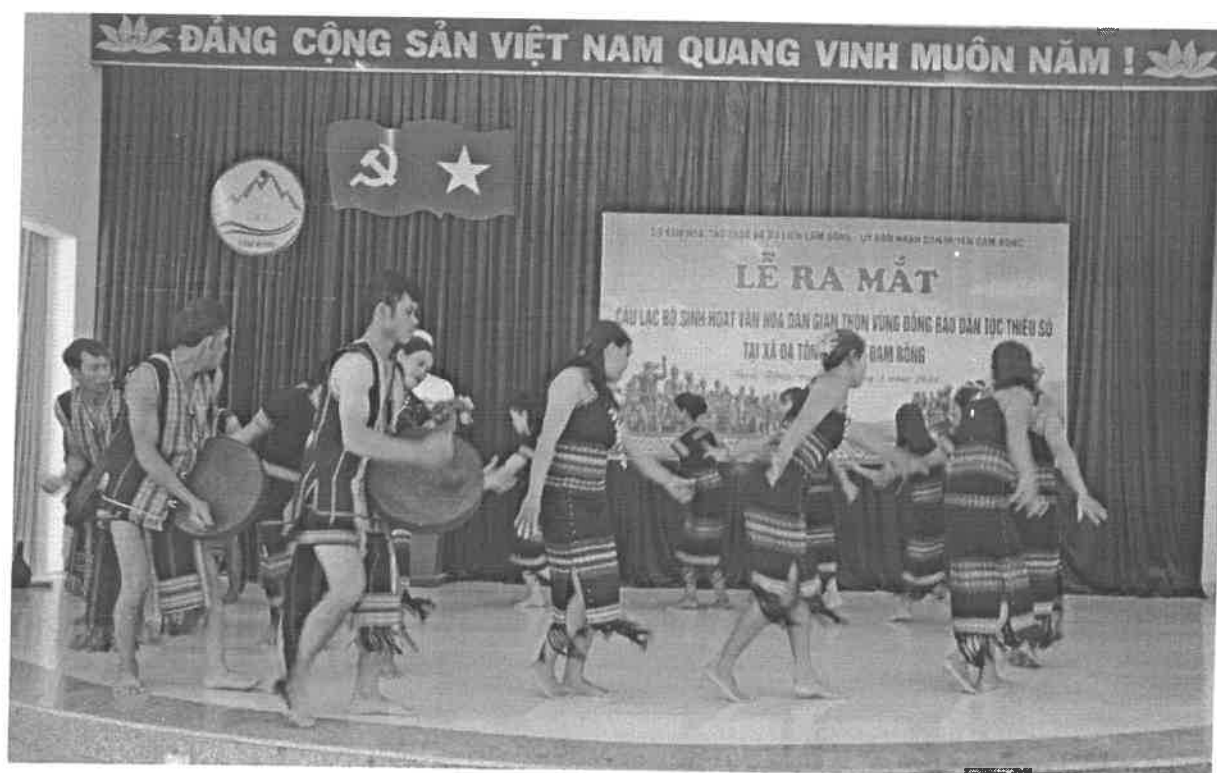
Câu lạc bộ công chiêng thôn Liêng Trang 1 biểu diễn múa truyền thống