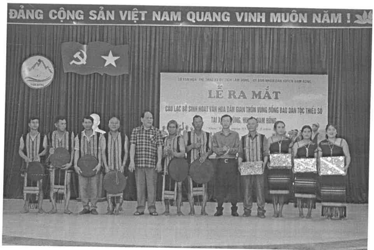
Trao nhạc cụ và trang phục cho Câu lạc bộ cồng chiêng thôn Liêng Trang 1