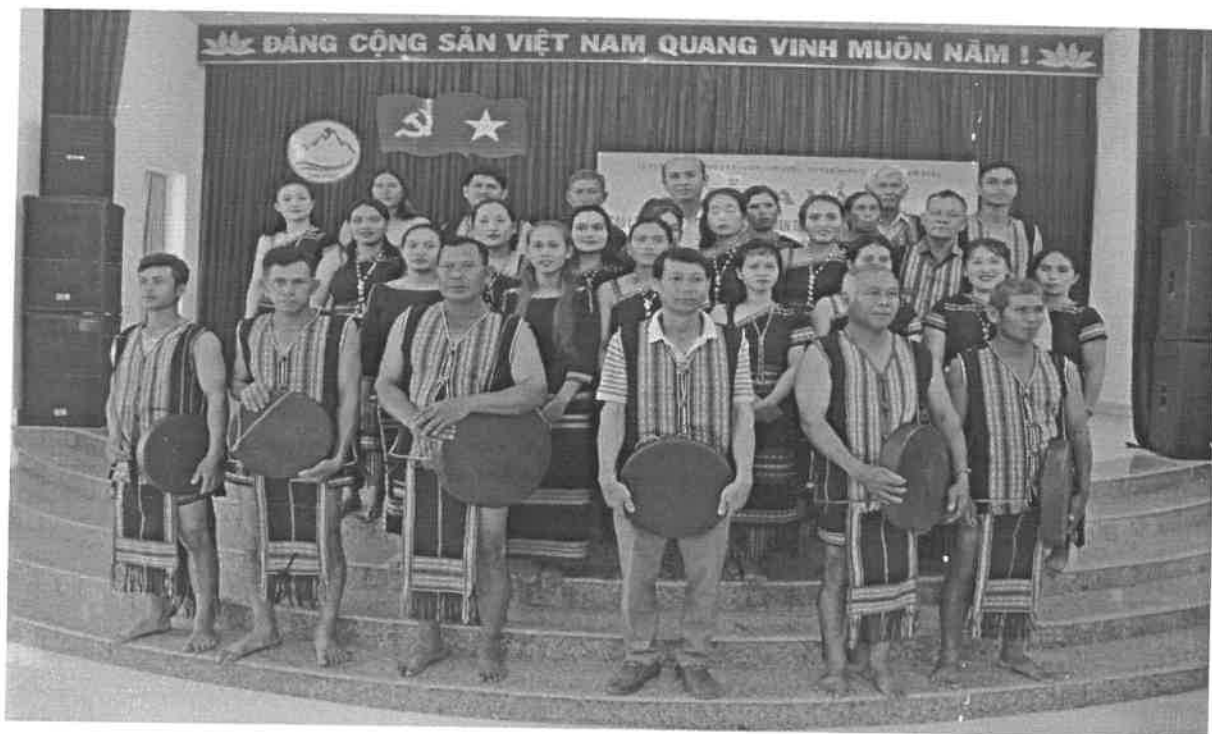
Ra mắt Câu lạc bộ công chiêng thôn Liêng Trang 1