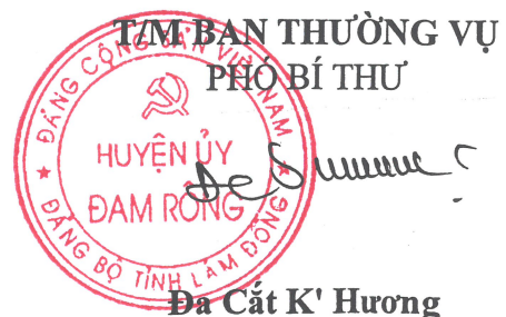
Đa Cát K' Hương